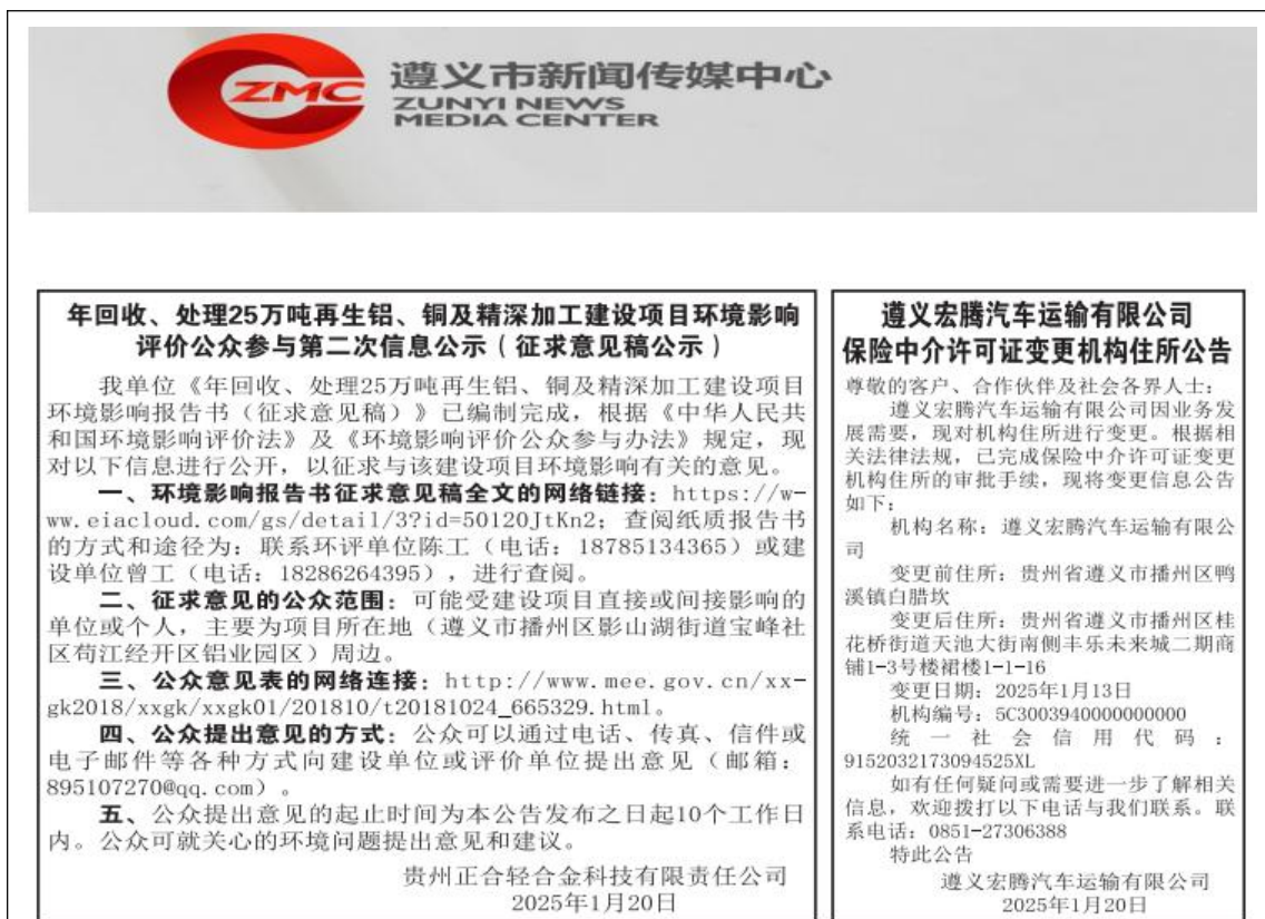
图 3-4 2025 年 1 月 21 日报纸公示