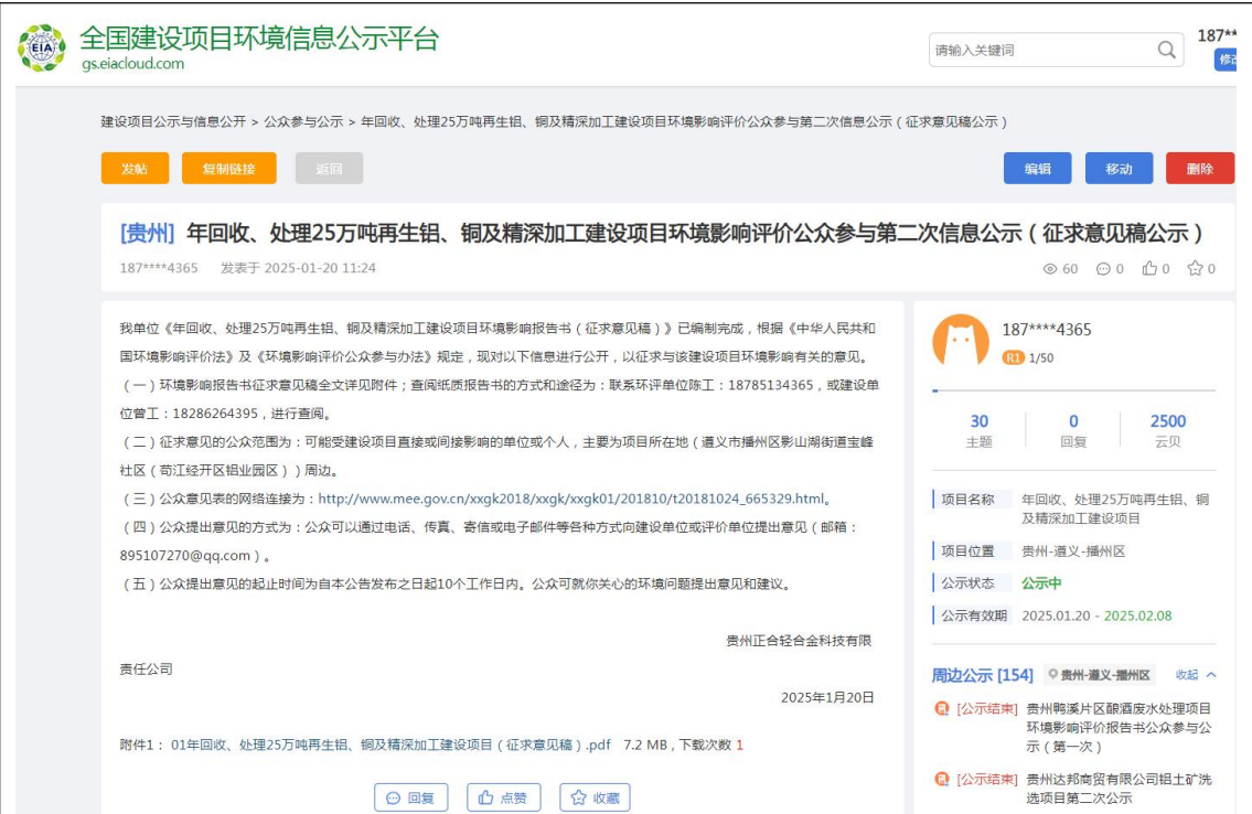
图 3-1 公众参与第二次信息公示网络公示截图