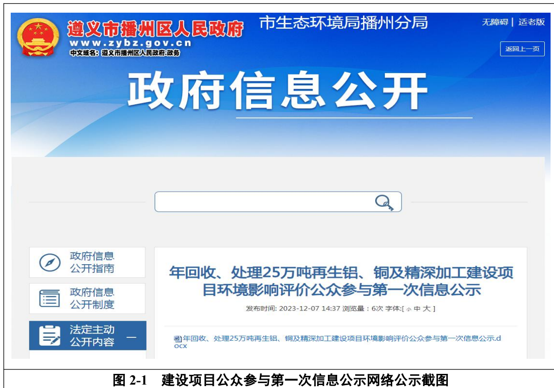
图 2-1 建设项目公众参与第一次信息公示网络公示截图

本次环评从公示发布之日起至征求意见稿编制完成时,接到少数电话咨询的公众,咨询内容均为与环境影响评价无关的其他意见,均未收到公众提出的与环境影响评价相关的意见,对于公众咨询的其他意见,环评不纳入分析。