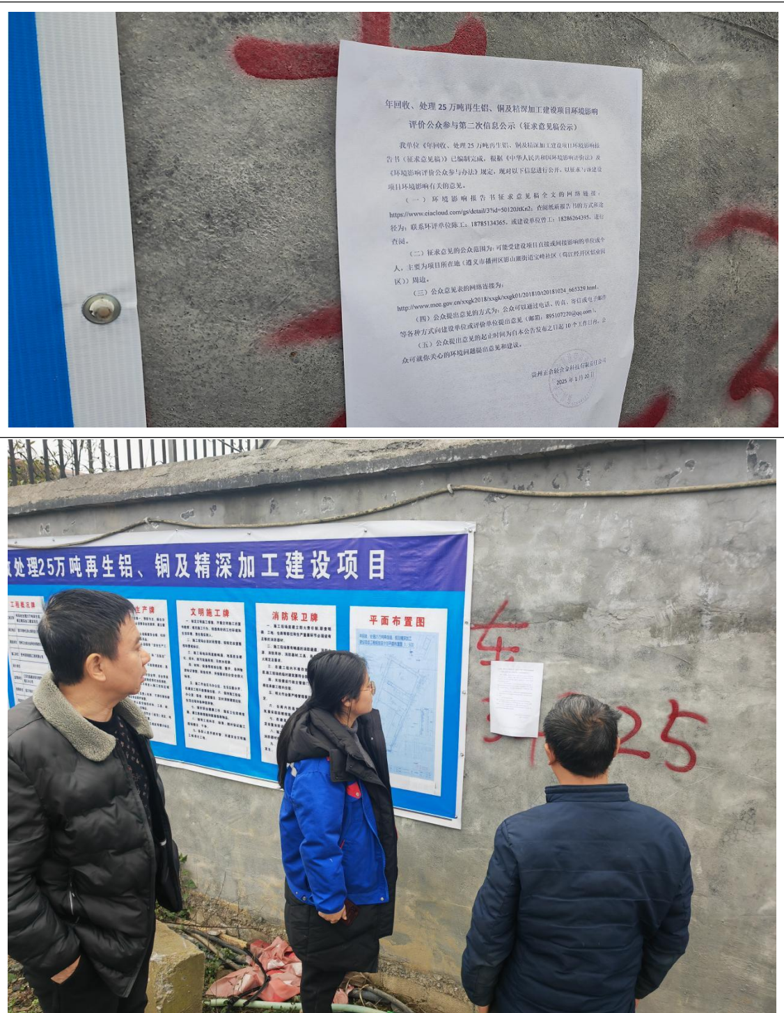
图 3-3 公众参与第二次信息公示张贴公示照片

为进一步告知当地群众，加深其对本项目的了解，按《环境影响评价公众参与办法》相关要求，于2025年1月21日在遵义市播州区影山湖街道宝峰社区（苟江经开区铝业园区）项目地公示栏行了张贴公示，公示期为10个工作日。此次张贴公示区域选取符合《环境影响评价公众参与办法》的要求。张贴公示照片见图3-3。