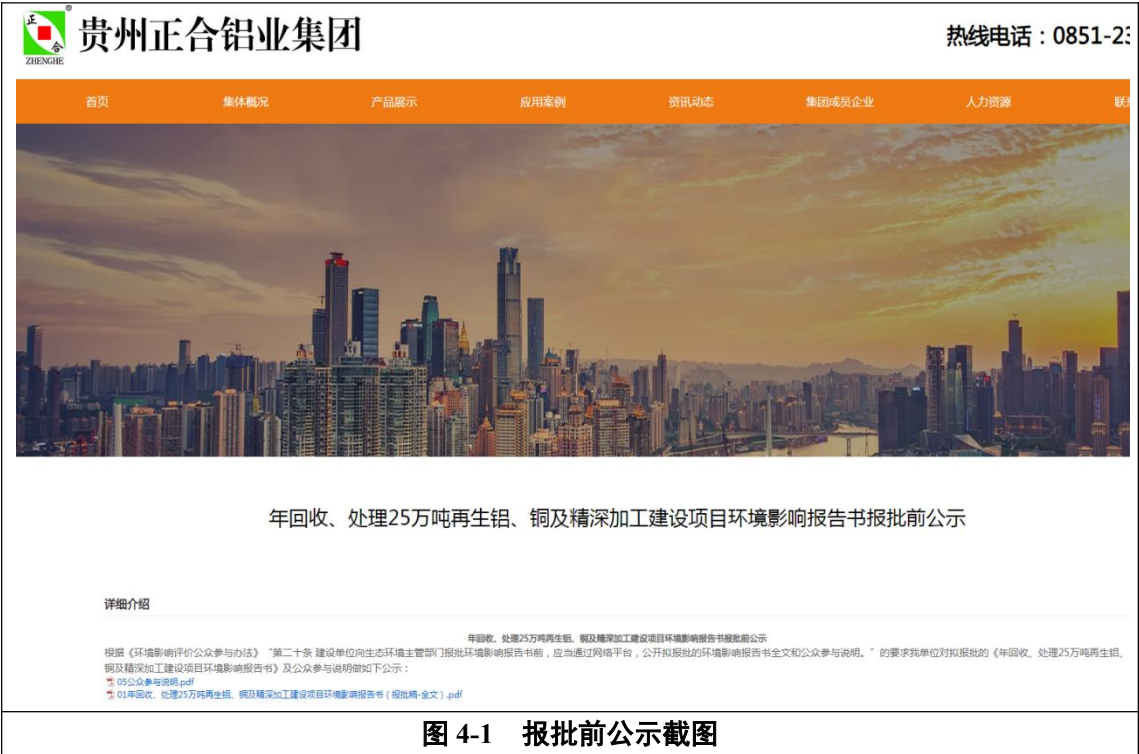
图 4-1 报批前公示截图

根据《环境影响评价公众参与办法》“第二十条 建设单位向生态环境主管部门报批环境影响报告书前，应当通过网络平台，公开拟报批的环境影响报告书全文和公众参与说明。”的要求我单位于 2025 年 5 月 22 日在我单位网站（ https://www.zhenghelvye.com/news/522.html ）对拟报批的《年回收、处理 25 万吨再生铝、铜及精深加工建设项目环境影响报告书》及公众参与说明进行了网络公示，公示截图详见图 4-1。