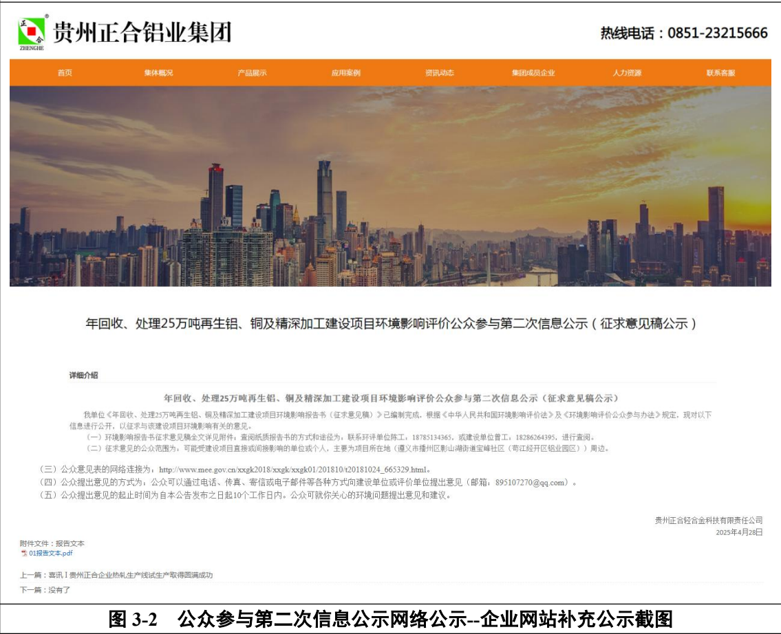
图 3-2 公众参与第二次信息公示网络公示--企业网站补充公示截图